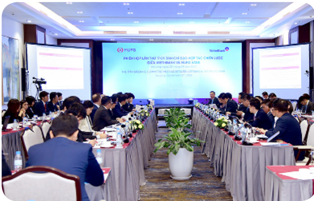
| Toàn cảnh Phiên họp