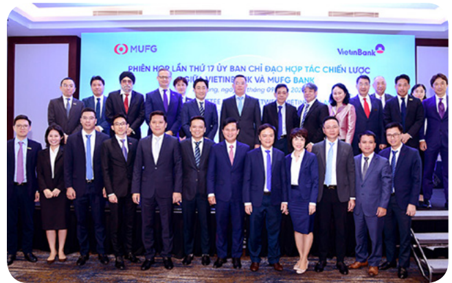
| Các đại biểu tham gia Phiên họp chụp ảnh lưu niệm

Chiều ngày 22/9/2022 tại TP. Hạ Long, tỉnh Quảng Ninh, Phiên họp lần thứ 17 của Ủy ban Chỉ đạo Hợp tác Chiến lược giữa VietinBank và MUFG Bank (Ủy ban) đã được tổ chức sau gần 3 năm họp trực tuyến do diễn biến phức tạp của dịch COVID-19 trên toàn cầu.