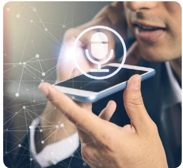
VB công nghệ sinh trắc học xác minh danh tính KH thông qua lời nói