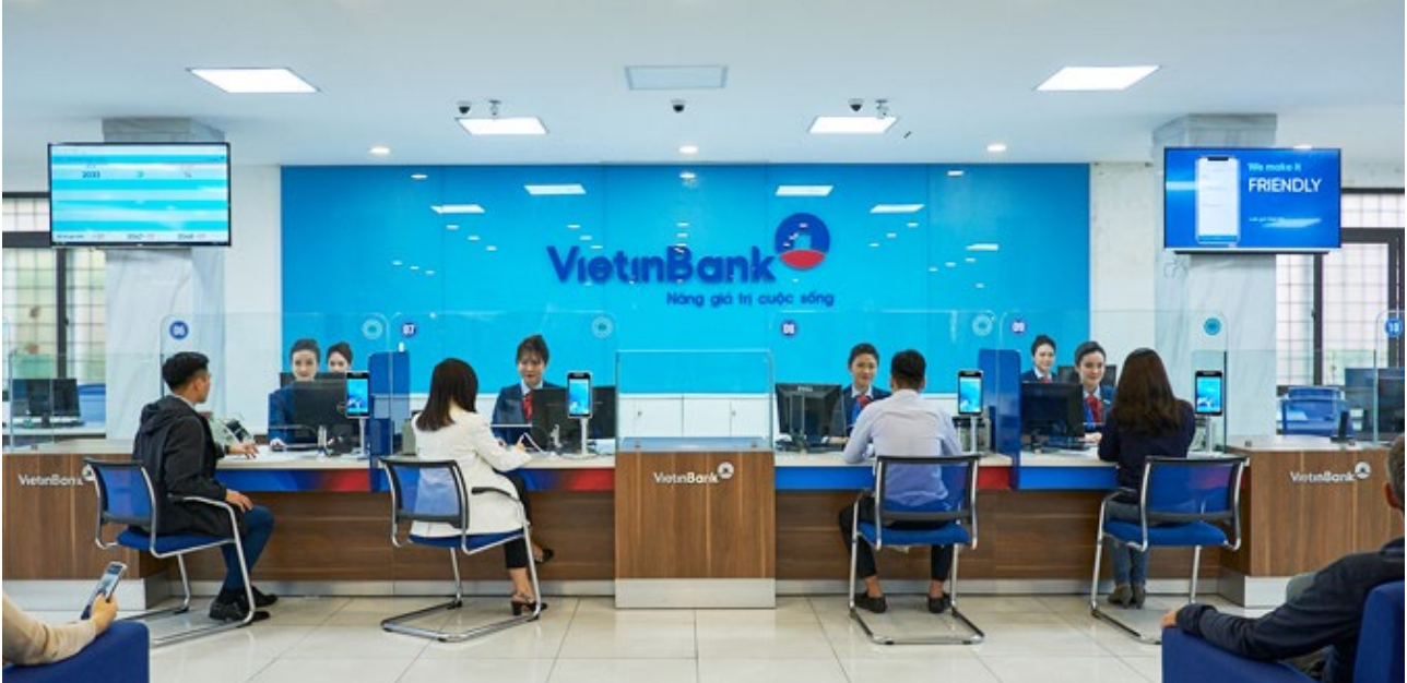
| VietinBank nằm trong danh sách Forbes Global 2000 năm 2022

Forbes Global 2000 – Bảng xếp hạng 2000 công ty đại chúng lớn nhất trên thế giới theo tạp chí Forbes năm 2022 vừa được Forbes bình chọn và công bố. Forbes Global 2000 dựa trên 4 tiêu chí cơ bản gồm: Doanh thu, lợi nhuận, tài sản và giá trị thị trường để xác định quy mô doanh nghiệp. Theo những tiêu chí này, VietinBank nằm trong Forbes Global 2000 năm 2022 với thứ hạng 1.560. Cụ thể, doanh thu của VietinBank đạt 4,41 tỷ USD, lợi nhuận đạt 612,4 triệu USD, tài sản đạt 67,2 tỷ USD và giá trị thị trường đạt 6,15 tỷ USD.