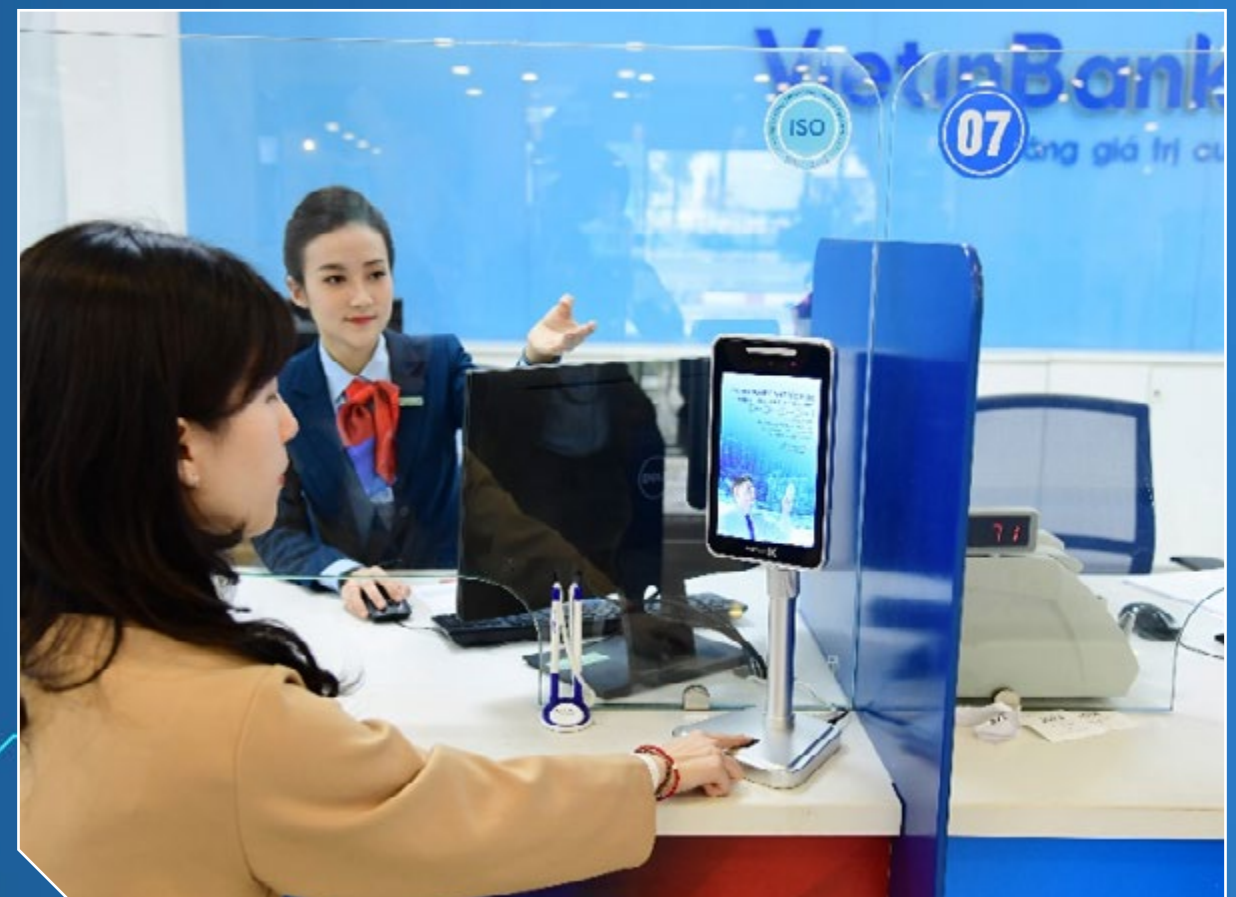
VietinBank đầu tư mạnh mẽ vào công nghệ bảo mật nhằm bảo vệ dữ liệu khách hàng

Việc đầu tư mạnh mẽ vào công nghệ bảo mật của VietinBank là vô cùng quan trọng trong công tác quản lý dữ liệu; tạo nền tảng cho việc phát triển ngân hàng số, hướng tới sự phát triển vững mạnh, hiện đại của ngân hàng trong tương lai ■