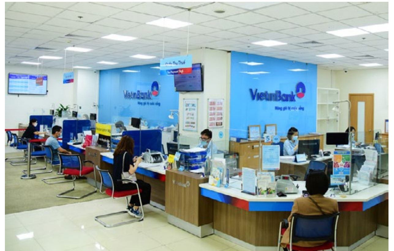
VietinBank phê duyệt Phương án tăng vốn điều lệ và tích cực, khẩn trương hoàn thiện các thủ tục để thực hiện tăng vốn.

Trên cơ sở Quyết định số 765/QĐ-TTg ngày 22/5/2021 của Thủ tướng Chính phủ về việc Phê duyệt phương án đầu tư bổ sung vốn Nhà nước tại VietinBank, Công văn số 3829/NHNN-TTGSNH ngày 28/5/2021 của Ngân hàng Nhà nước Việt Nam về việc Phương án đầu tư bổ sung vốn Nhà nước tại VietinBank, ngày 31/5/2021,