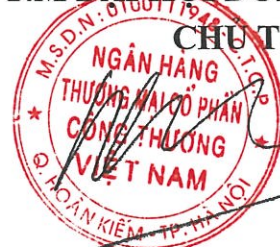
Lê Đức Thọ